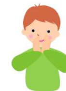
Les merveilles de Dieu

AUSSITÔT, les disciples ouvrent portes et fenêtres, et sortent de la maison. Ils se mettent à parler des merveilles de Dieu et de Jésus ressuscité : « Il est vivant ! Quelle bonne nouvelle ! » Devant eux, une foule s'est rassemblée – gens d'ici et d'ailleurs, de villes proches et de pays lointains, d'Europe, d'Afrique, d'Amérique et d'Asie. Et chacun, émerveillé, les comprend dans sa propre langue. Quelle joie !