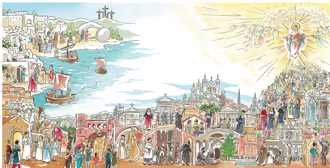
Illustrations : Cécile Guinement

L'image du peuple de Dieu en marche peut aussi soutenir notre quête.