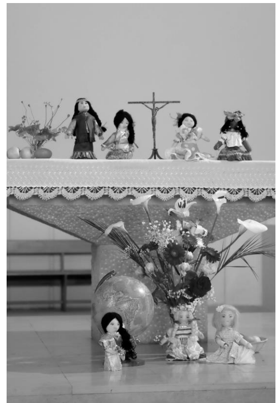
L'autel à la fête des peuples