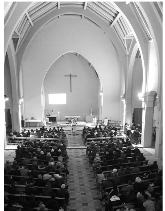
Une veillée pascale lumineuse