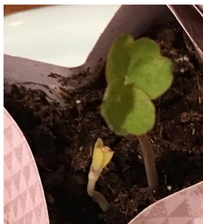
Une graine de l'Aube Pascale a été plantée

Pendant ce temps pascal n'est-ce pas l'occasion de prier l'Esprit Saint aux sept dons ? Esprit de sagesse, de discernement, de conseil, de force, de connaissance, d'humilité et de confiance. Si nous sommes appelés à regarder ce qui dans notre vie n'est pas signe de cet amour de Dieu et des autres, ce n'est